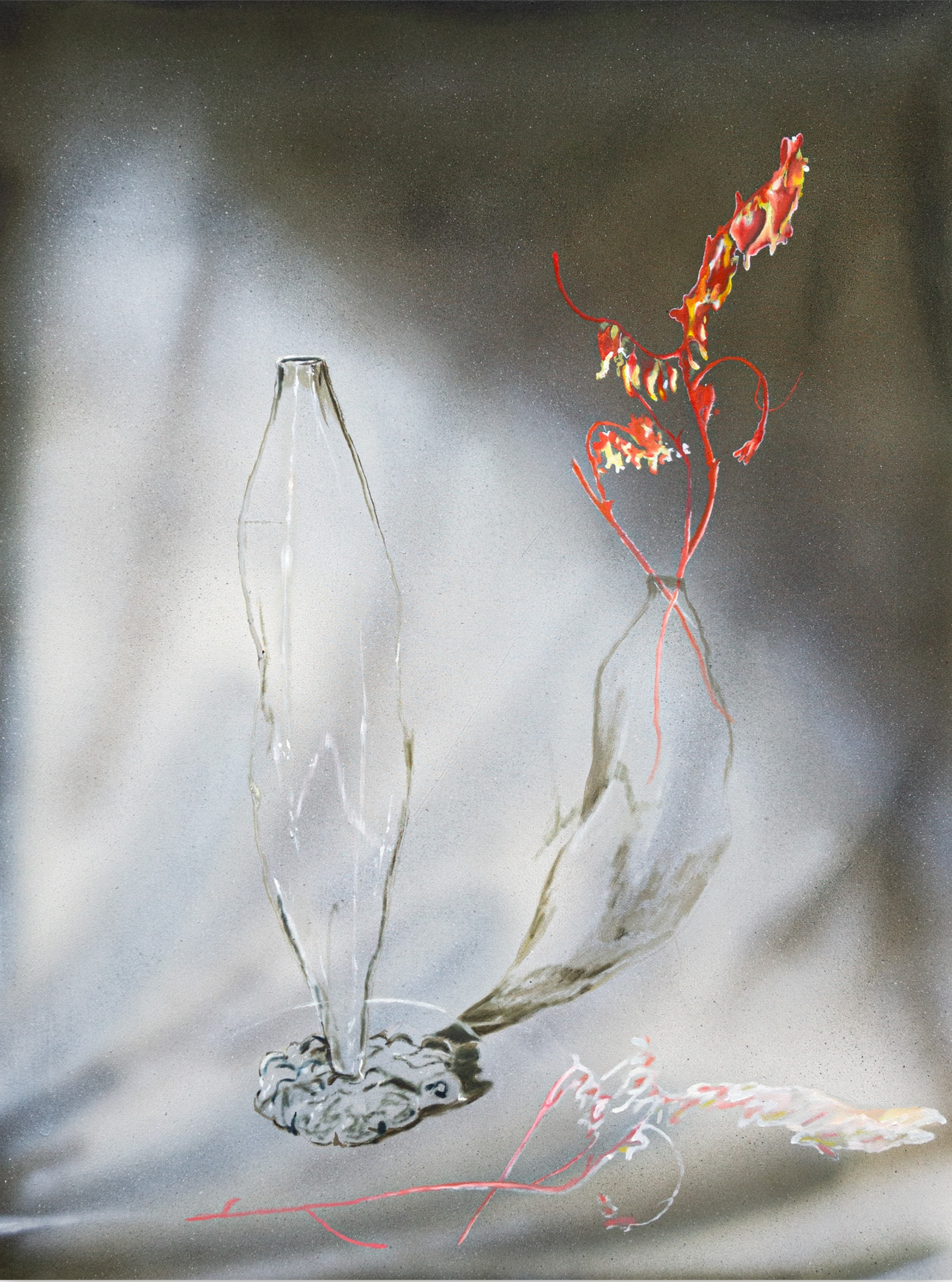
La coda dell'occhio 2024 acrilico e olio su tela 60 x 80 cm