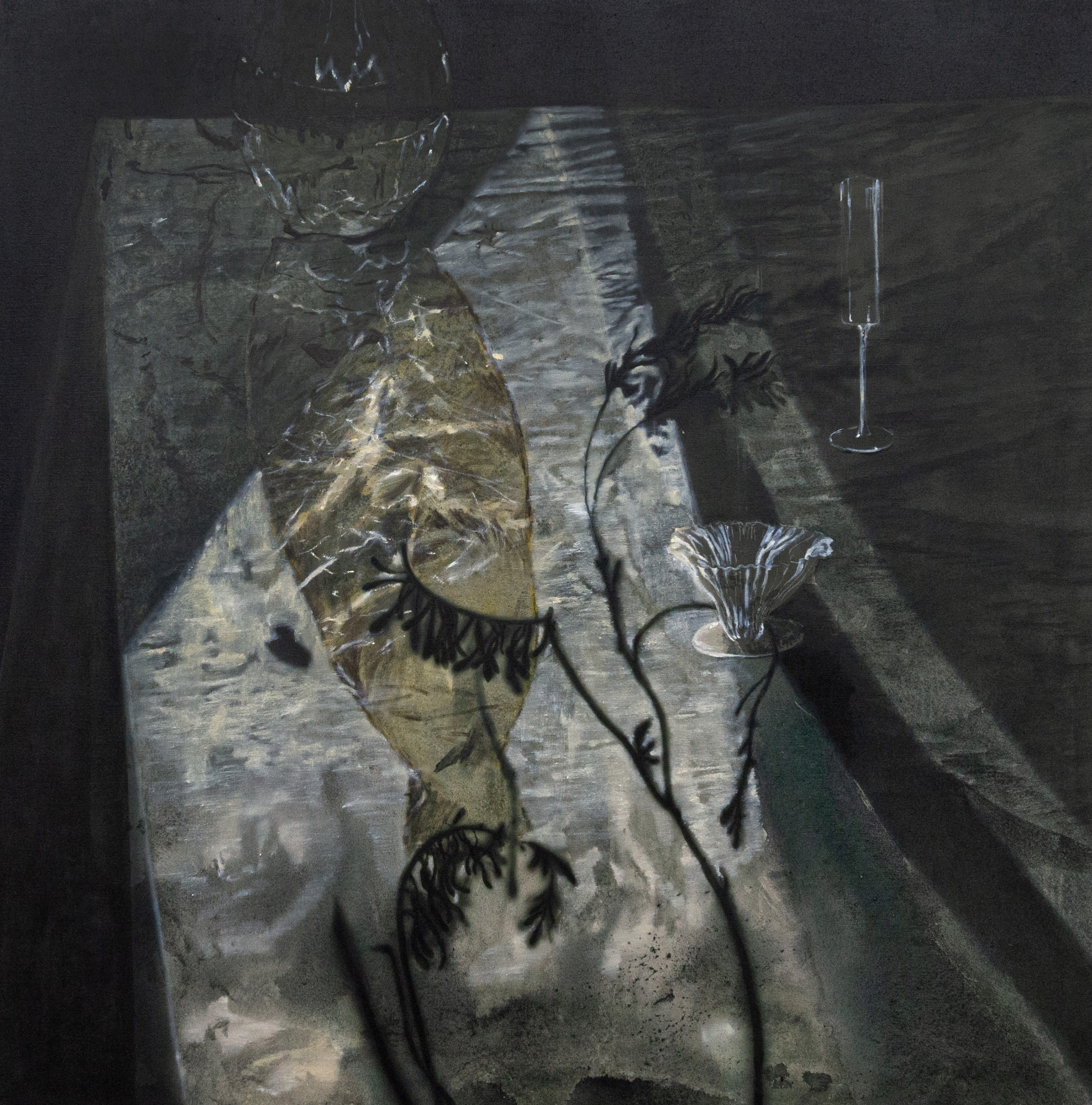
Accigliato per il sole 2024 acrilico e olio su tela 100 x 100 cm